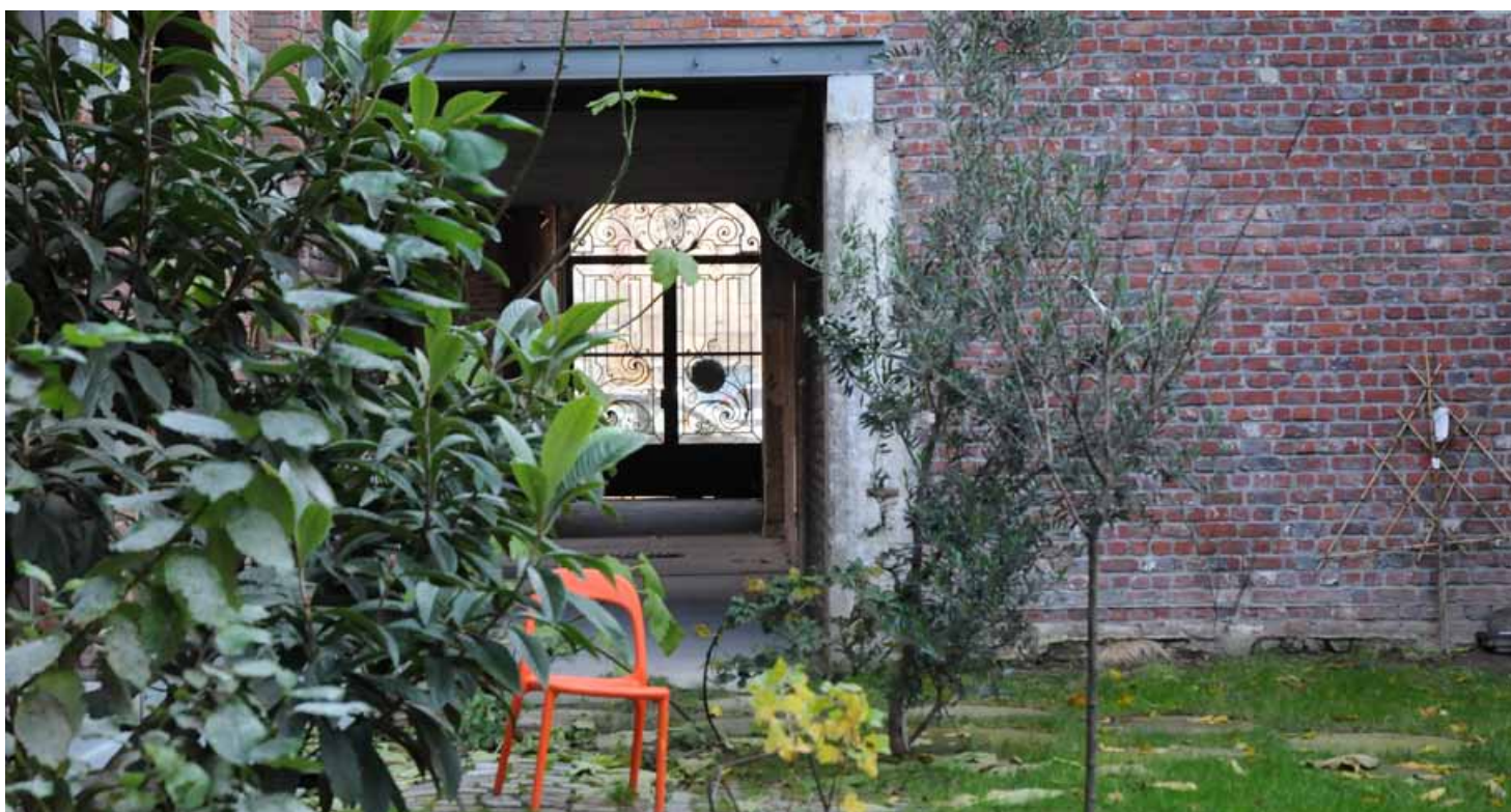
In 2008 kregen enkele vervallen gebouwen aan de Poincarélaan een nieuwe bestemming: zestien appartementen, een kantoor voor een architectenbureau en een ruimte voor yoga en Indische massages. Oorspronkelijk was dit vervallen gebouwencomplex een kleinschalig stedelijk weefsel van steegjes en arbeiderswoningen, dat in de 20e eeuw werd omgevormd tot een edelsmederij. Op de foto de plaats waar zich in de 19e eeuw de 'Impasse du Soleil' bevond. ▲