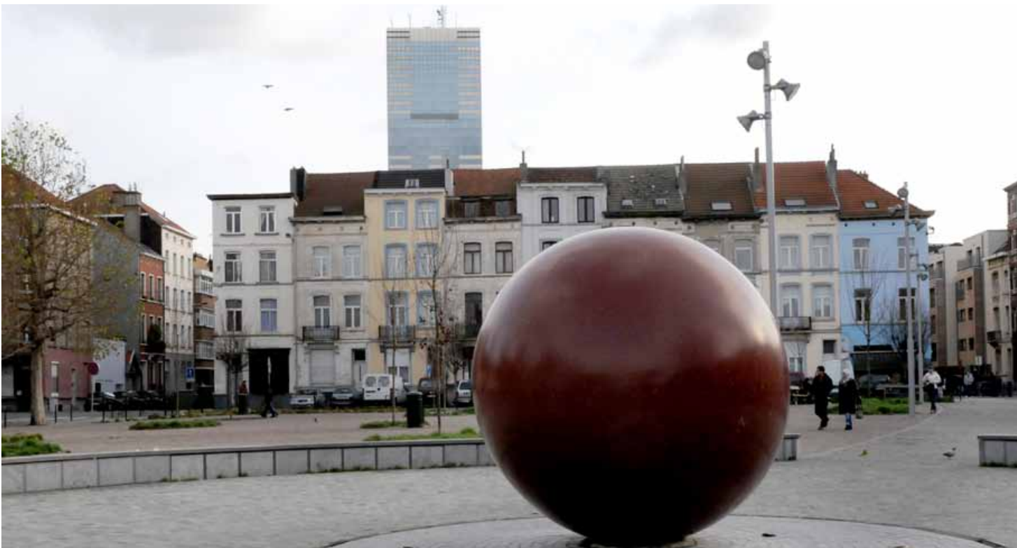
Het Jorezplein, met centraal de bolvormige waterpartij, werd opnieuw aangelegd met middelen afkomstig uit het wijkcontract Raad. Achter de huizen aan de Klinikstraat ziet men de Zuidertoren die in 1966 werd gebouwd door gastarbeiders. ▲