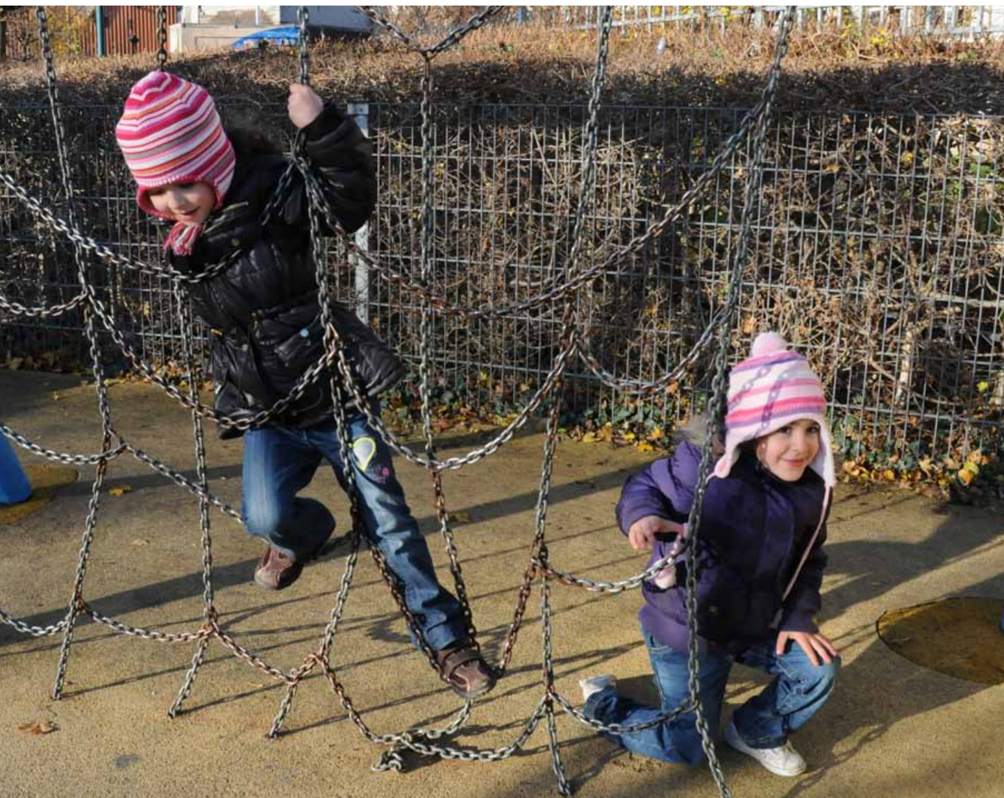
Spelende kinderen in het Dauwpark. Dit park met speelterrein is één van de mooiste plekjes in onze hoofdstad. ▲