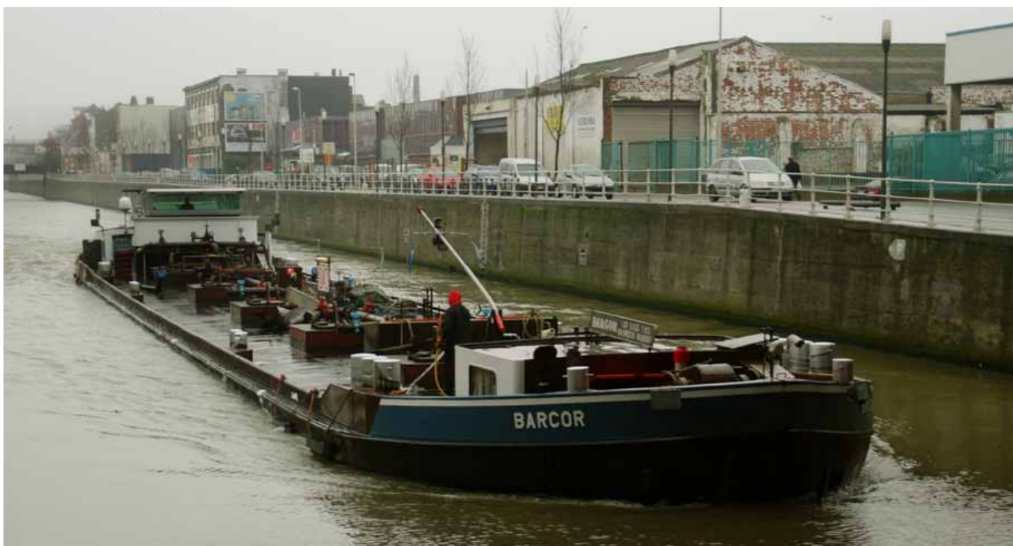
Het kanaal naar Charleroi met op de rechteroever de Nijverheidskaai (Kuregem) ter hoogte van de gemeentegrens Anderlecht en Sint-Jans-Molenbeek. ▲