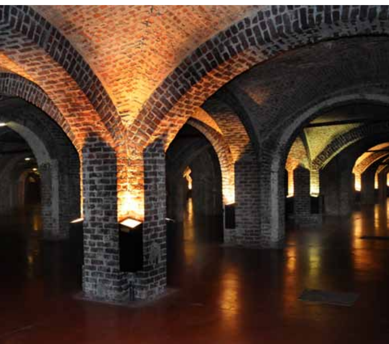
Bakstenen tongewelven schragen de overdekte veemarkt. Vandaag worden deze 'Kelders van Cureghem' gebruikt als evenementenzaal. ◀

Recenter werd ook een overdekt agroalimentair park in gebruik genomen. Abattoir wil het complex in de nabije toekomst verder uitbreiden met steun van het Europees Fonds voor Regionale Ontwikkeling. Er komt ruimte voor een voedingsmarkt, een nieuwe vleesmarkt, appartementen en burelen. De bouw ervan zal in verscheidene fasen verlopen zodat aanpassingen in functie van de economische haalbaarheid mogelijk blijven. De winkelpaviljoenen langs de Ropsy-Chaudronstraat en waarschijnlijk ook de huidige vleesmarkt worden dan afgebroken. De toegang tot de site langs de Ropsy-Chaudronstraat wordt zo helemaal