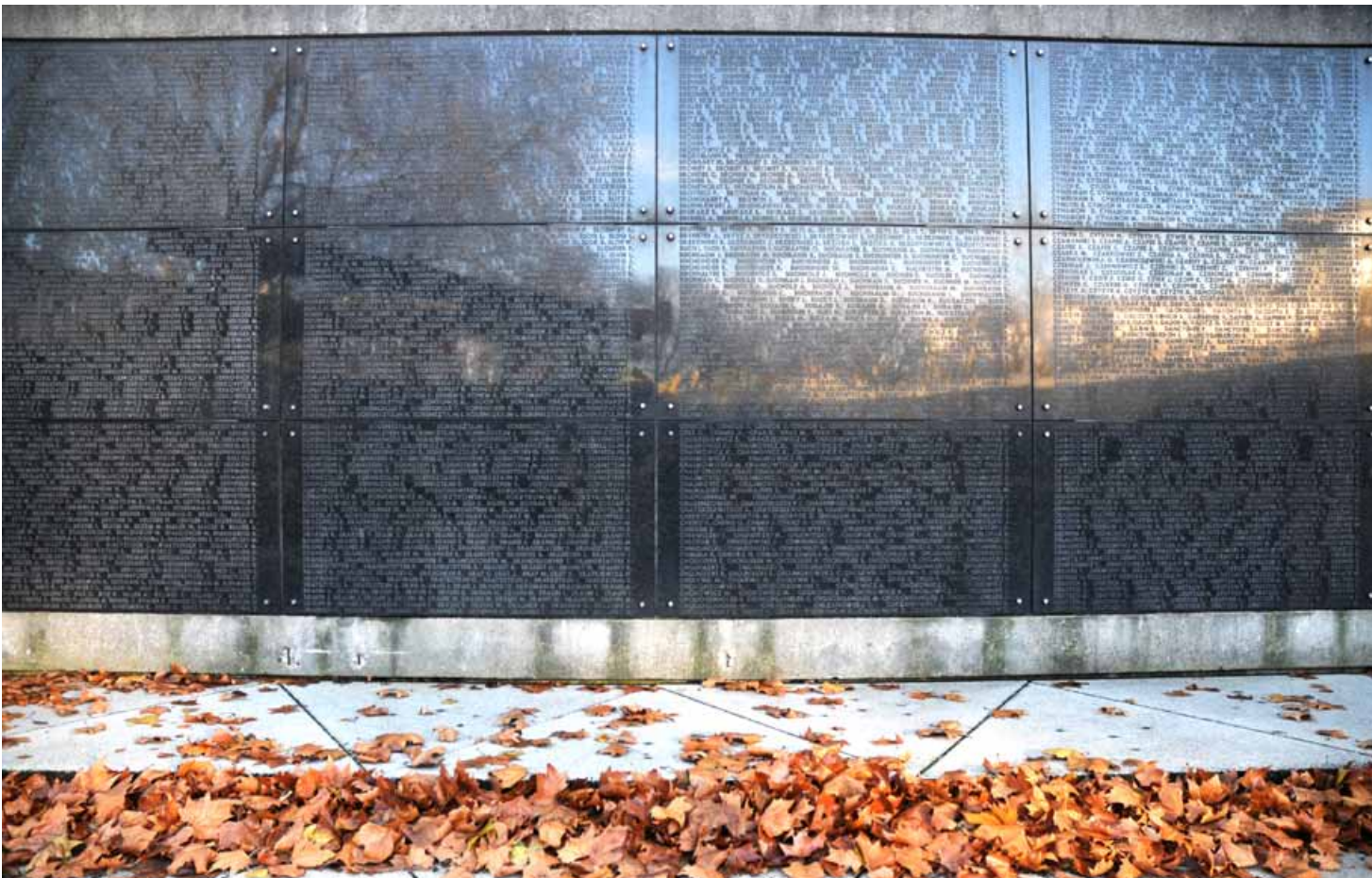
De 23 838 namen van de joden die naar Duitsland werden gedeporteerd en niet zijn teruggekeerd staan gebeiteld in de indrukwekkende herdenkingsplaten in zwarte graniet van het Nationaal Gedenkteken der Joodse Martelaren van België. ▲

B ij aanvang van de Tweede Wereldoorlog woonden er ongeveer 25 000 joden in Brussel. In verhouding werden er in Brussel minder joden gedeporteerd dan in Antwerpen omdat er in Brussel een actiever verzet was. In Antwerpen verleenden de administratie en de politie hun medewerking aan de Duitse bezetter o.a. bij de verdeling van de Davidster. De Brusselse burgemeesters echter weigerden die te verdelen. In Kuregem bestond er een actief verzet. Verschillende clandestiene kranten werden hier gedrukt en het verzet hielp joden om onder te duiken. Het is niet toevallig dat vandaag zowel het 'Nationaal Museum van de Weerstand' als het 'Nationaal Gedenkteken der Joodse Martelaren van België' zich in Kuregem bevinden.