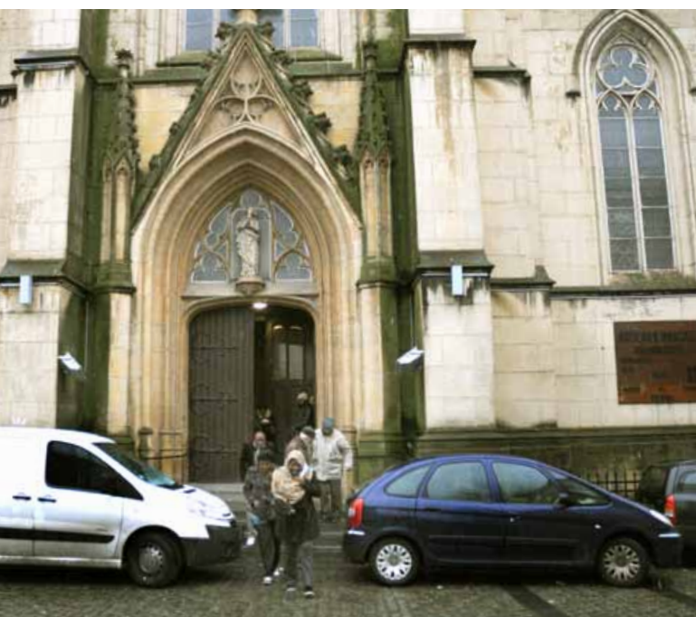
In 1856 werd de Onze-Lieve-Vrouw Onbevleete Ontvangenisparochie opgericht. In 1861 werden de werken aangevat voor de bouw van een neogotische kerk die werd ingezegend in 1877. ◀

De twee parochies Onze-Lieve-Vrouw en Sint-Franciscus Xaverius vormen al meer dan 25 jaar de pastorale eenheid Kuregem. Vieringen in Kuregem vinden plaats in het Nederlands, het Frans, het Spaans en het Engels. De eerste drie gemeenschappen bestonden reeds langer in Kuregem samen met een Italiaanse geloofsgemeenschap. Een tijdlang was er ook een viering in het Portugees. De vieringen in het Italiaans verdwenen uit Kuregem. Vanaf de jaren 90 kwamen veel Zwart-Afrikaanse christenen in Kuregem wonen. Zo is er sinds 1998 ook een Engelstalige zondagsviering in de Onze-Lieve-Vrouwkerk. De verschillende gemeenschappen in Kuregem houden ook regelmatig interculturele vieringen waarin momenteel gebruik wordt gemaakt van vier talen. Sinds 1990 is pastoor Jan Claes verantwoordelijk voor de Nederlandstalige pastoraal, hierin bijgestaan door pater Hugo Carmeliet, die vroeger werkte als priester-arbeider in Kuregem, en zuster Godelieve Roeykens, pastorale werkster sinds vele jaren.