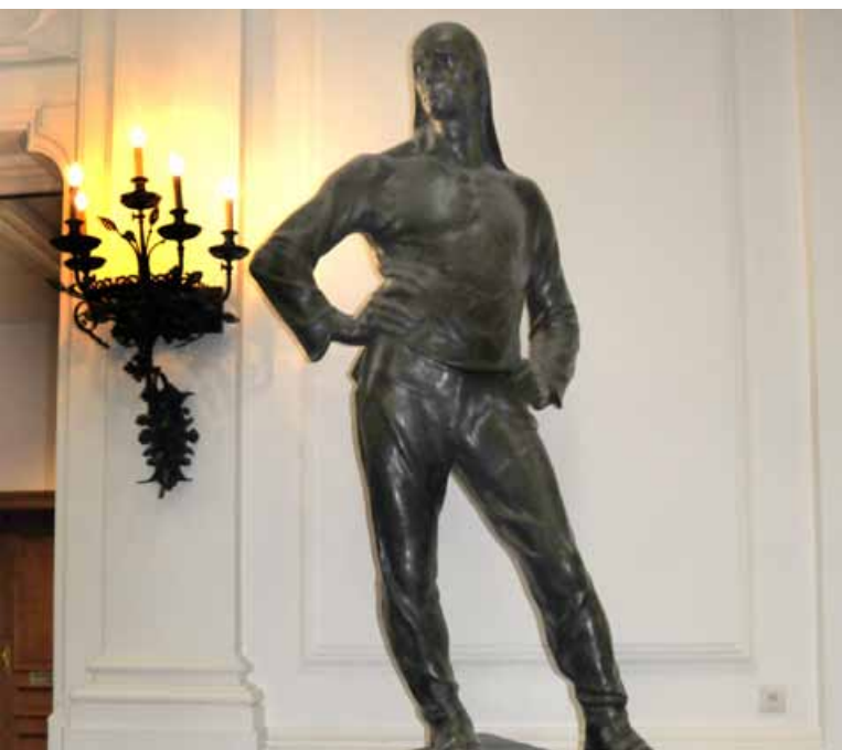
In de inkomhal van het gemeentehuis staat 'De Dokwerker', een kalkafgietsel van het werk van beeldhouwer Constantin Emile Meunier. ◀

Omdat dit op protest stootte van het toenmalige gemeentebestuur, gooiden de industriëlen met hun immobiliënmaatschappij, de 'Société Immobilière de Cureghem', het over een andere boeg. Ze boden de gemeente gratis grond aan om daarop binnen zeven jaar een gemeentehuis te bouwen. De industriëlen stelden eveneens een som geld ter beschikking om de bouw te bekostigen. De gemeente ging akkoord en besliste in 1872