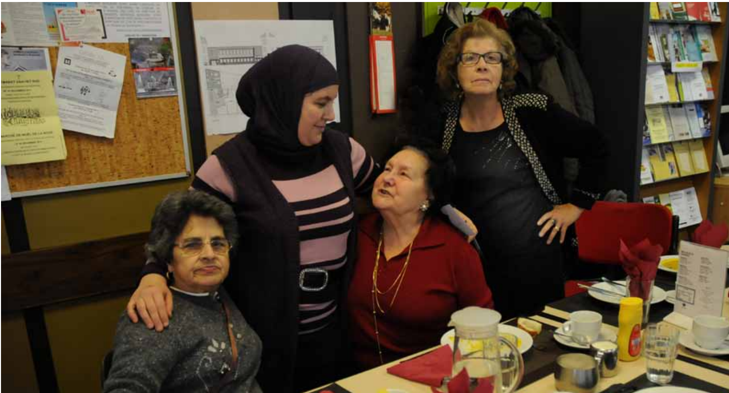
Vrouwen van Italiaanse, Marokkaanse en Spaanse origine tijdens het middagmaal in Cosmos. Het lokaal dienstencentrum Cosmos biedt kansen tot interculturele ontmoeting en uitwisseling. ▲