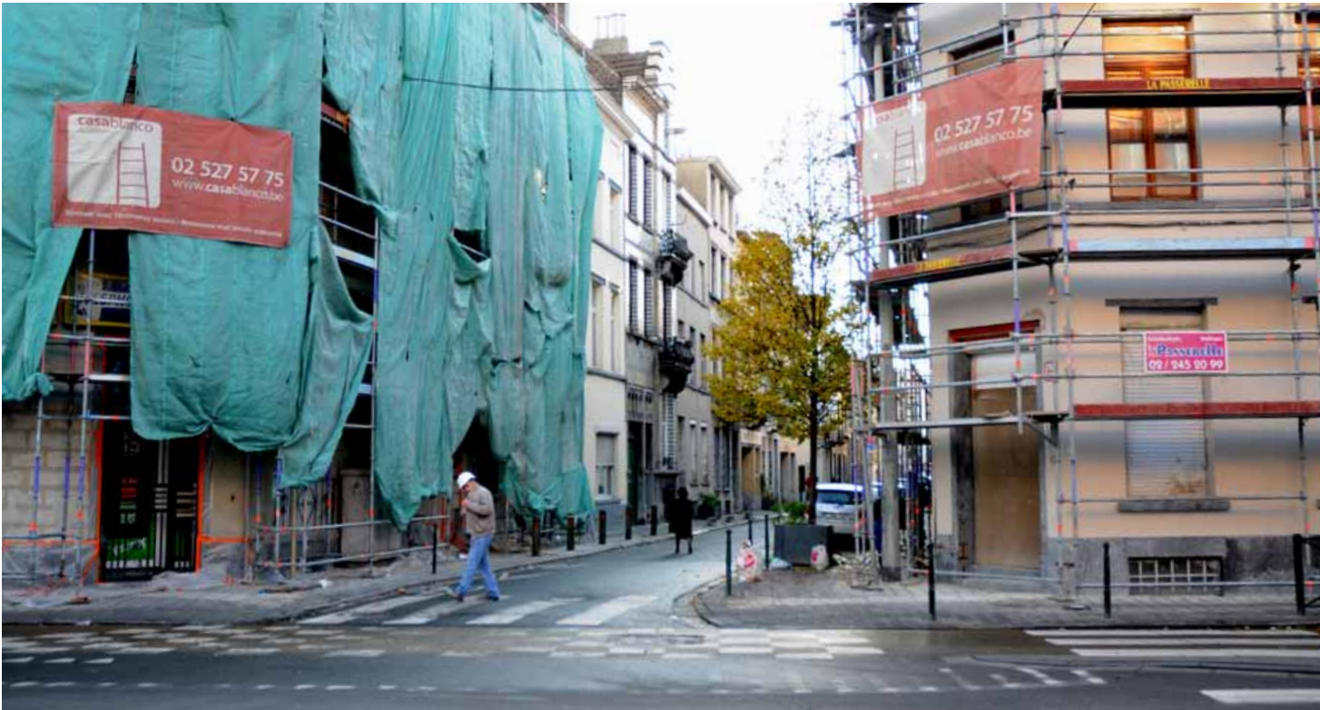
Renovatiewerken van enkele gevels aan de Bergensesteenweg uitgevoerd door Casa Blanco, één van de Kuregemse initiatieven voor de ontwikkeling van de werkgelegenheid waarbij langdurig werklozen werkervaring kunnen opdoen. ▲