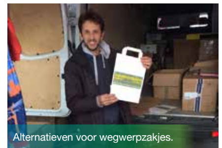
Alternatieven voor wegwerpzakjes.

De sleutels van het succes waren ongetwijfeld een goede sensibilisering en het samen zoeken naar oplossingen, in combinatie met regelmatige controles en daarbovenop een boetesysteem. "De communicatie van het Gewest in het voorjaar van 2016 over de invoering van een gewestelijk verbod heeft ons uiteraard hard geholpen om de handelaars te overtuigen van het belang om het probleem aan te pakken", vertrouwt Mohamed Ibrir ons toe.