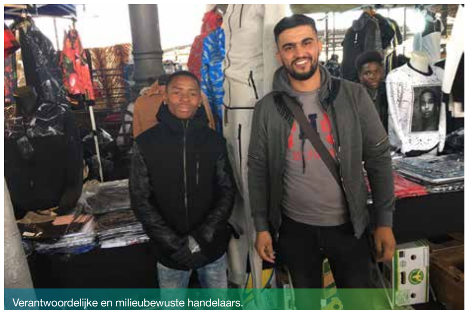
Verantwoordelijke en milieubewuste handelaars.

Het doel? De plastic zakken op het marktterrein volledig afschaffen en de nodige hulpmiddelen creëren om de betrokken partijen te helpen om mee te evolueren naar een nettere en meer milieuvriendelijke markt.