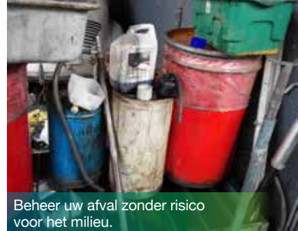
Beheer uw afval zonder risico voor het milieu.