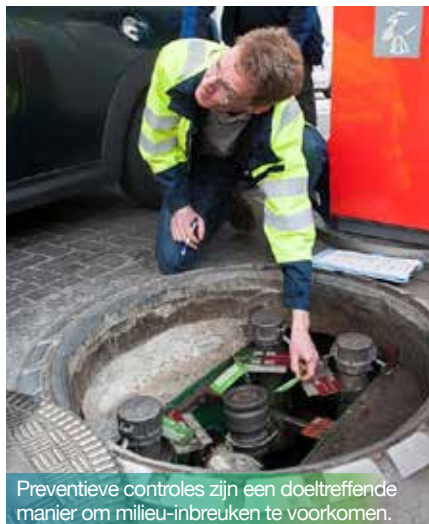
Preventieve controles zijn een doeltreffende manier om milieu-inbreuken te voorkomen.

Het vademecum is gemakkelijk toegankelijk via online fiches die de inbreuken in 13