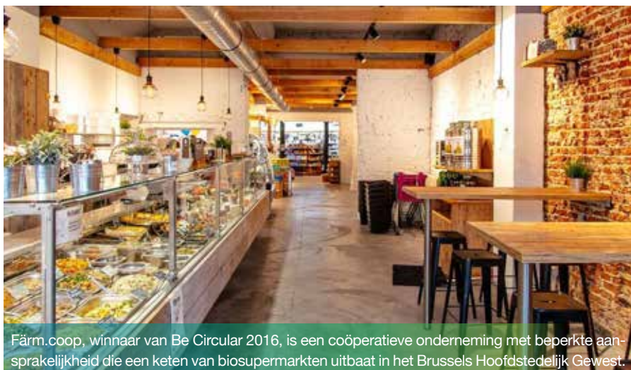
Färm.coop, winnaar van Be Circular 2016, is een coöperatieve onderneming met beperkte aansprakelijkheid die een keten van biosupermarkten uitbaat in het Brussels Hoofdstedelijk Gewest.