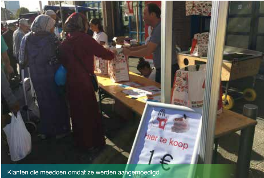
Klanten die meedoen omdat ze werden aangemoedigd.

Abattoir heeft het verbod geleidelijk aan ingevoerd, met een stappenplan. De eerste fase bestond erin de 600 handelaars te overtuigen geen plastic zelfbedieningszakken meer ter beschikking te stellen en er alleen te geven als de klanten erom vroegen. Vervolgens is vanaf januari 2016, product per product, het verbod ingegaan: tweedehandsspullen en planten, elektrische toestellen en huishoudartikelen, textiel, droge voeding en ten slotte groenten en fruit. De laatste fase was veruit de moeilijkste om door te voeren maar de handelaars zijn er uiteindelijk in geslaagd een haalbaar alternatief te vinden dat aan hun behoeften beantwoordt.